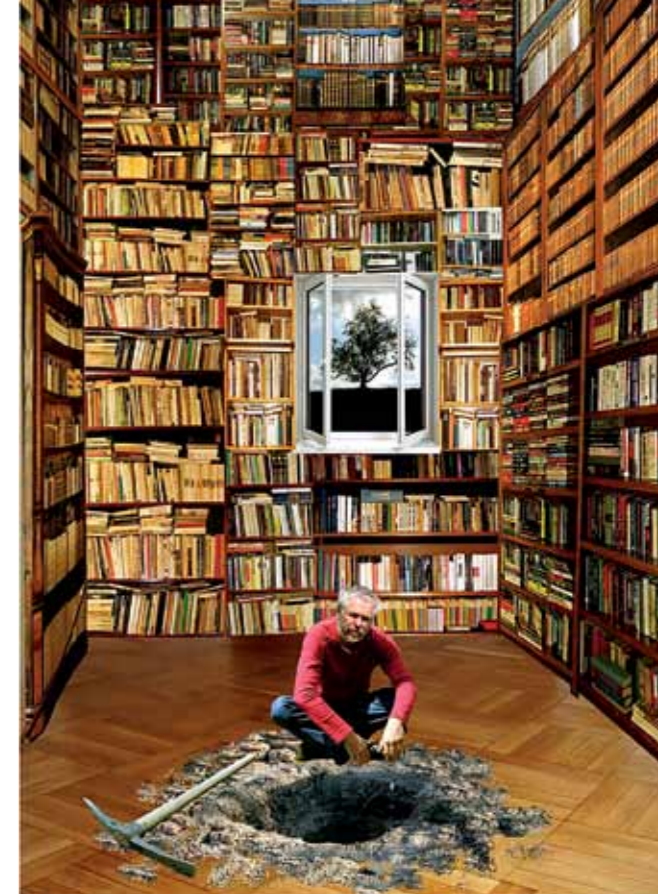
Huptychův autoportrét s názvem Hledání pravdy .

Až v patnácti letech, když mi měli dělat občanku, přečetl jsem si to v rodném listě. Byl to pro mě šok.