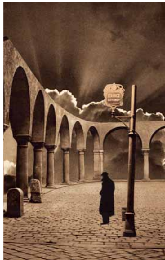
▲ Ukázka z koláží Miroslava Huputyčy; vlevo Kafkárna , vpravo Konečná .