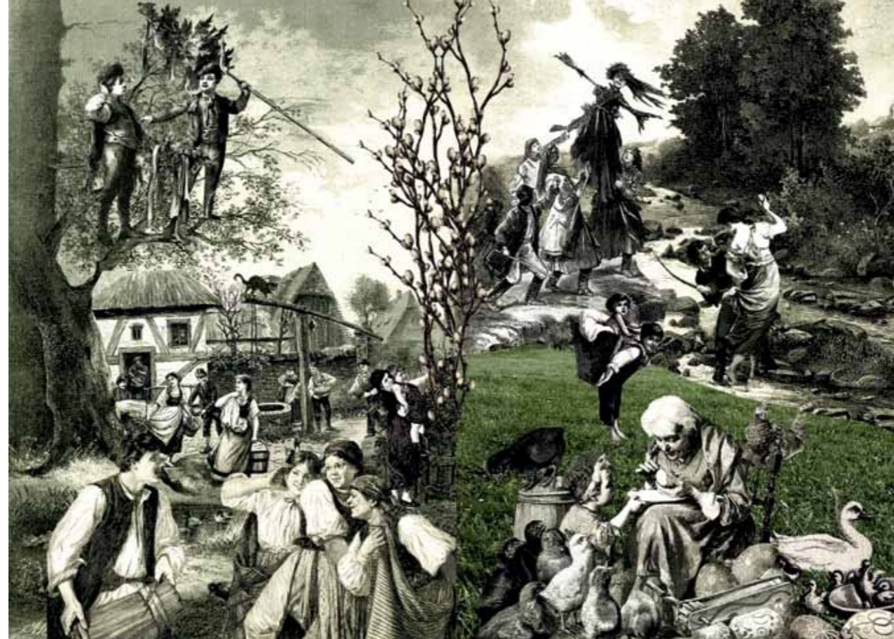
Ilustrace románu Babička od Boženy Němcové.

Meditace a zásadní změna životního stylu, přestal jsem jíst maso a začal jsem běhat. A jak píše Komenský v Labyrintu , kdy Poutník uslyší hlas: „Navrať se odkud jsi vyšel, do domu svého srdce, a zavři za sebou dveře...“ Pokusil jsem se vyčistit srdce