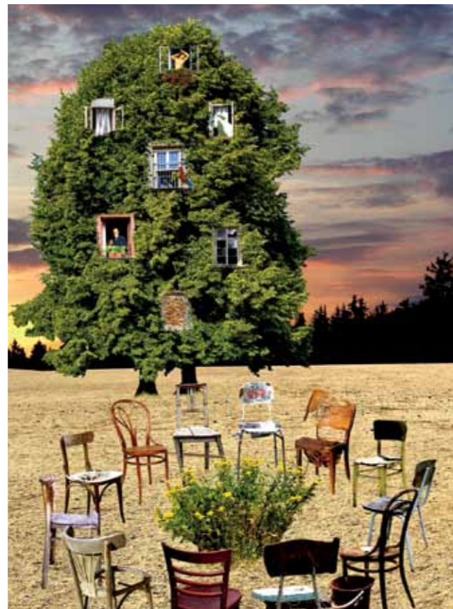
Koláže s názvem Drogy (motiv boje s větrným mlýnem) a Psychoterapie . „Pracoval jsem s drogově závislými v komunitě Magdaléna,“ vzpomíná autor. „Všechno jsem si hrozně bral a prožíval to s nimi. Po třech letech na mě z toho přišla deprese.“