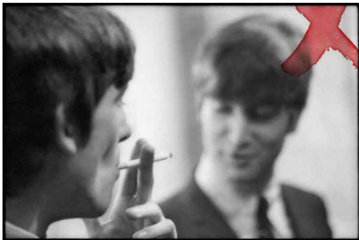
Značka X na fotce naznačuje, že byla vybrána z kontaktní kopie; dělal jsem ji na snímcích, které patřily k mým oblíbeným.