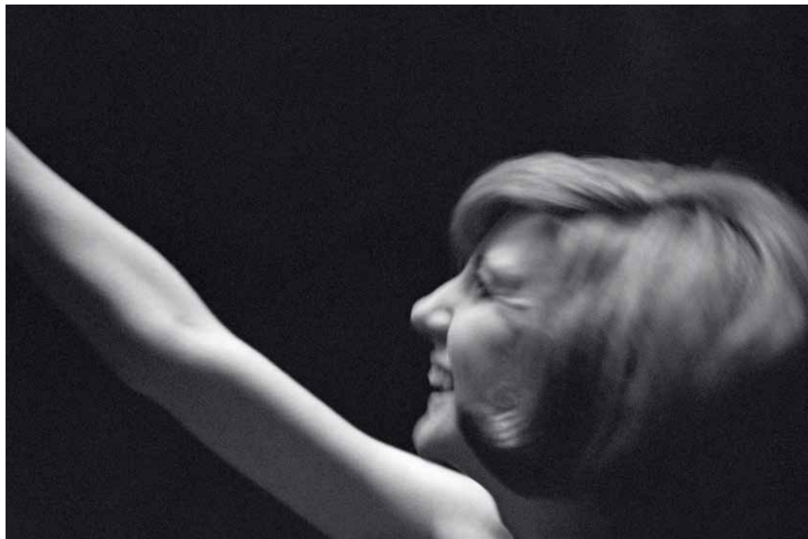
Úžasný charakter a osobitý hlas dovedly Cillu Black z šatny v The Cavern Clubu na veľká pódia. Její původní jméno znělo Priscilla White.