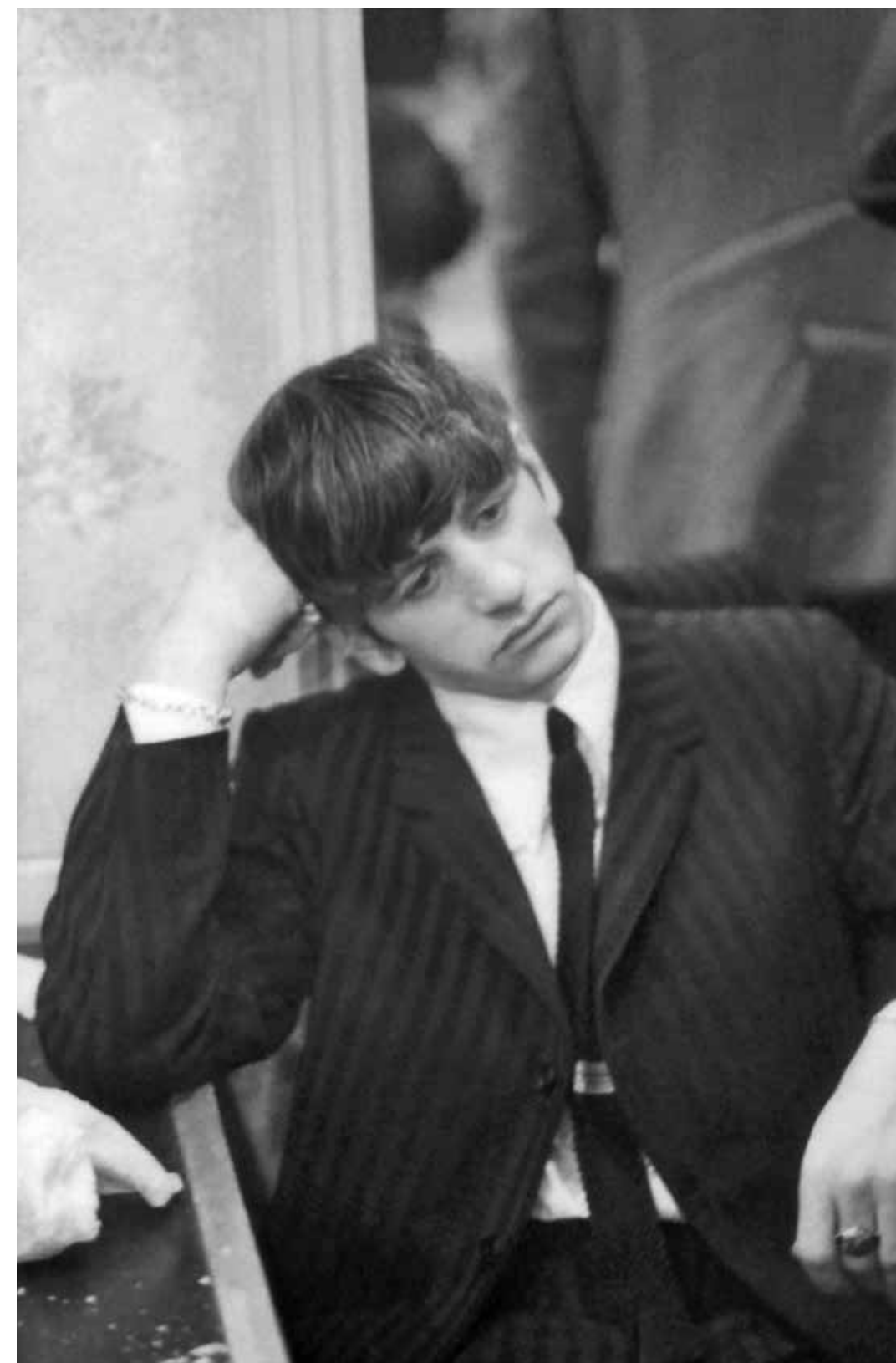
V této fázi byl Ringo v kapele už rok a půl, ale stále si vzpomínám na naše první společné hraní. S Johnem a Georem jsme si vyměnili pohledy a věděli jsme: To je ono!